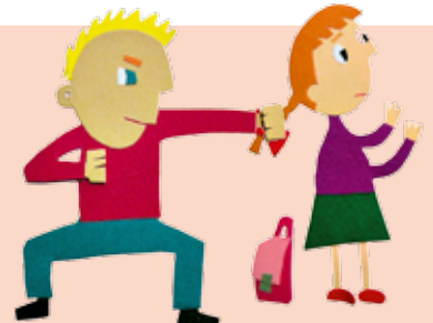
Апликация Марии Сосниной