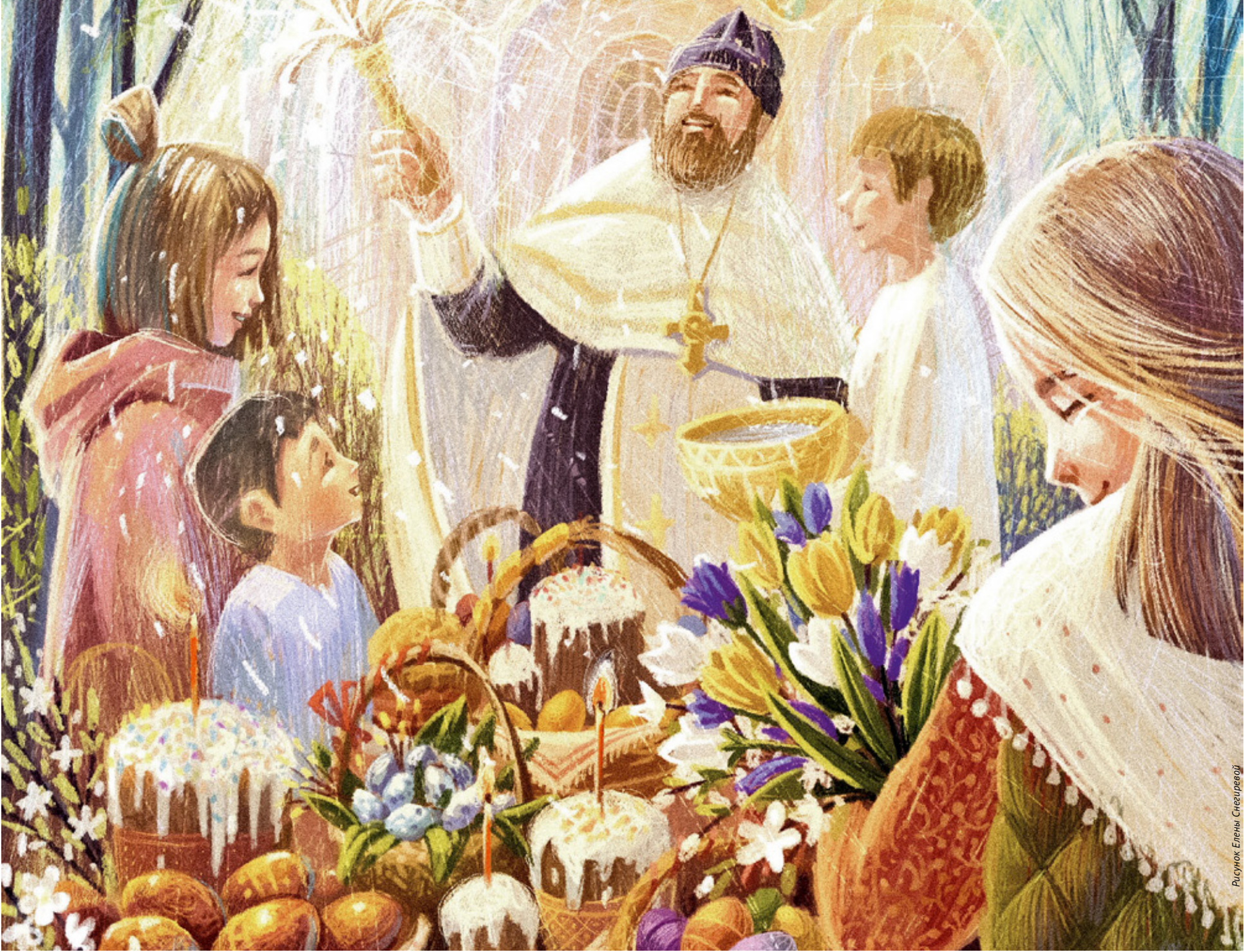
Рисунок Елены Снегиревой