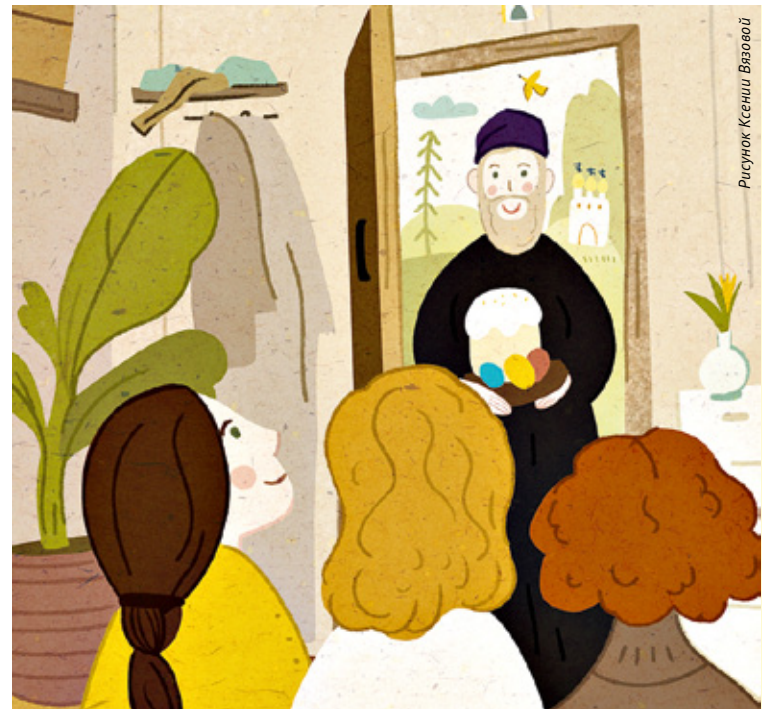
Рисунок Ксении Вязовой

Удивительно, но однажды, услышав в который раз этот рассказ, я почувствовал, как что-то кольнуло меня в сердце: а ведь этот вопрос — а ты просил Бога? — заданный больше полувека назад и не мне, как раз для меня! Ведь у меня же столько всего, о чем надо у Него просить —